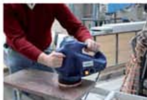
Lucidatura o cristallizzazione Polishing or crystalization