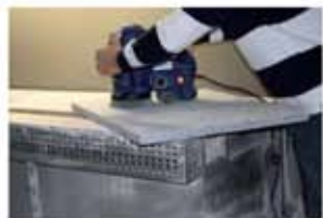
Levigatura, anche di superfici grezze Hard grinding on raw surfaces