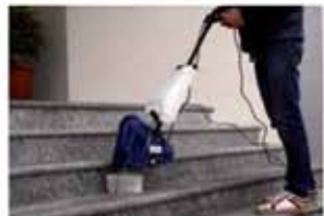
Pulizia a fondo delle scale esterne Cleaning of outside stairs