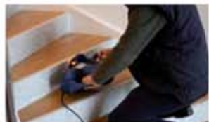
Pulizia delle scale interne Cleaning of inside stairs