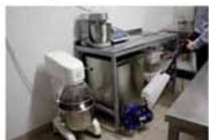
Pulizia degli ambienti per usi alimentari Cleaning of professional workshops