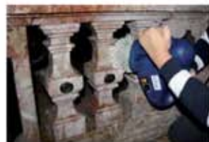
Pulizia nei punti difficili Cleaning on narrow surfaces

Trasmissione diretta senza cinghia Inducted transmission (no belt pulley)