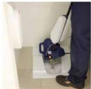
Igienizzazione dei sanitari Sanitization of toilets