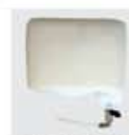
art. AC5500.10.04 Serbatoio Combi Tank for Combi